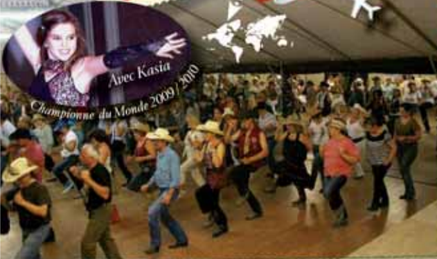
Avec Kasia Championne du Monde 2009 / 2010

* J. 12 Women Folk, Hugues Aufray * V. 13 One Way, Charlie Mc Coy, Liane Edwards * S. 14 Music Road Pilots, Poulpe-Again